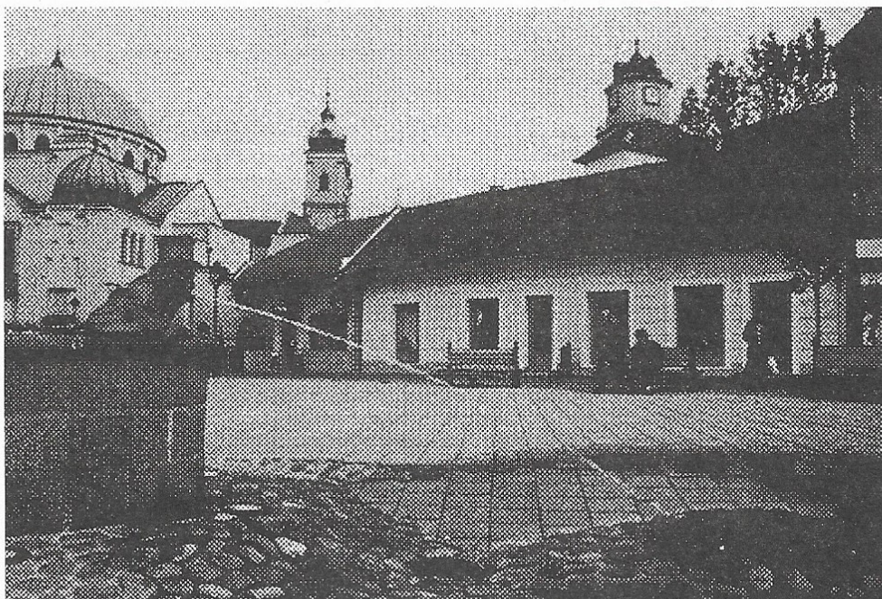
Mestská pamiatková rezervácia Trenčín - Štúrovo námestie - realizácia obnovy. Prezentácia historickej studne s výtvarným dotvorením