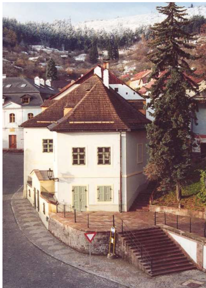
:: Detašované pracovisko FA STU v Banskej Štiavnici.

:: Budova Fakulty STU v Bratislave - pohľad z Námestia slobody.