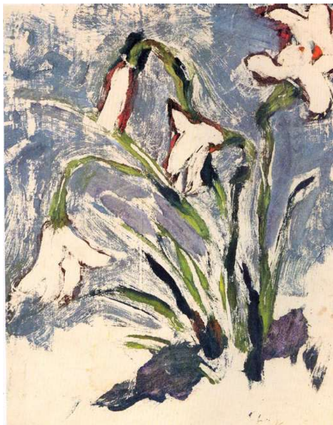
:: Kvety. 1930. Kartón, monotypia.