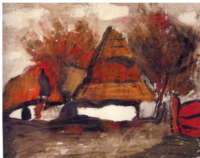
:: Chalupy II. 1931. Papier, monotypia.