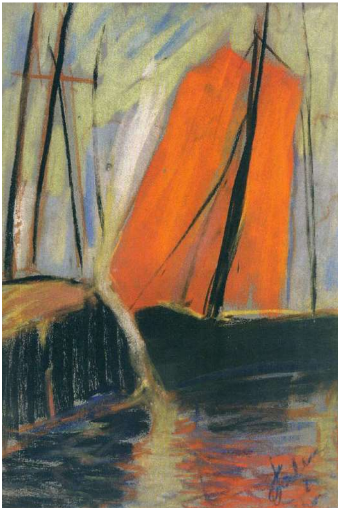
:: Červená jachta. 1925. Kartón, pastel.

Senzitívne vnímal výnimočnosť tradičnej ľudovej kultúry, tvorivú silu jej prejavu, pričom sa nechával priamo inšpirovať bohatstvom krajinných a figurálnych motívov. Uchvátili ho najmä hory, rozkvitnuté lúky a zákutia s vidieckou architektúrou. Častými motívmi v jeho tvorbe boli motívy stromov a kvetov.