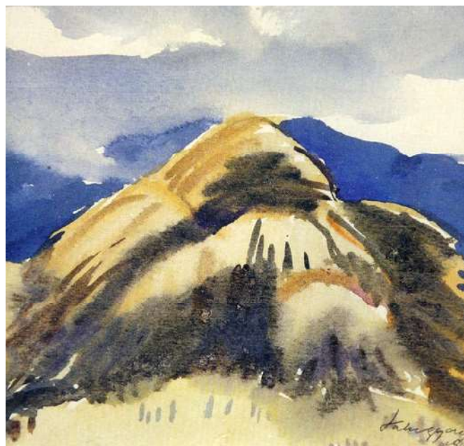
:: Snopy s obilím. 1930. Papier, akvarel.

Kniha reprezentuje celú šírku umelcovho tematického zámeru a význam jeho tvorby. Svojim rozsiahlym a mimoriadne významným dielom úprimne vyznal lásku, úctu a obdiv k Slovensku, jeho prírode a ľudu. Inšpiroval sa krajinou samotnou, ale i tvarovou a farebnou krásou ľudového výtvarného prejavu.