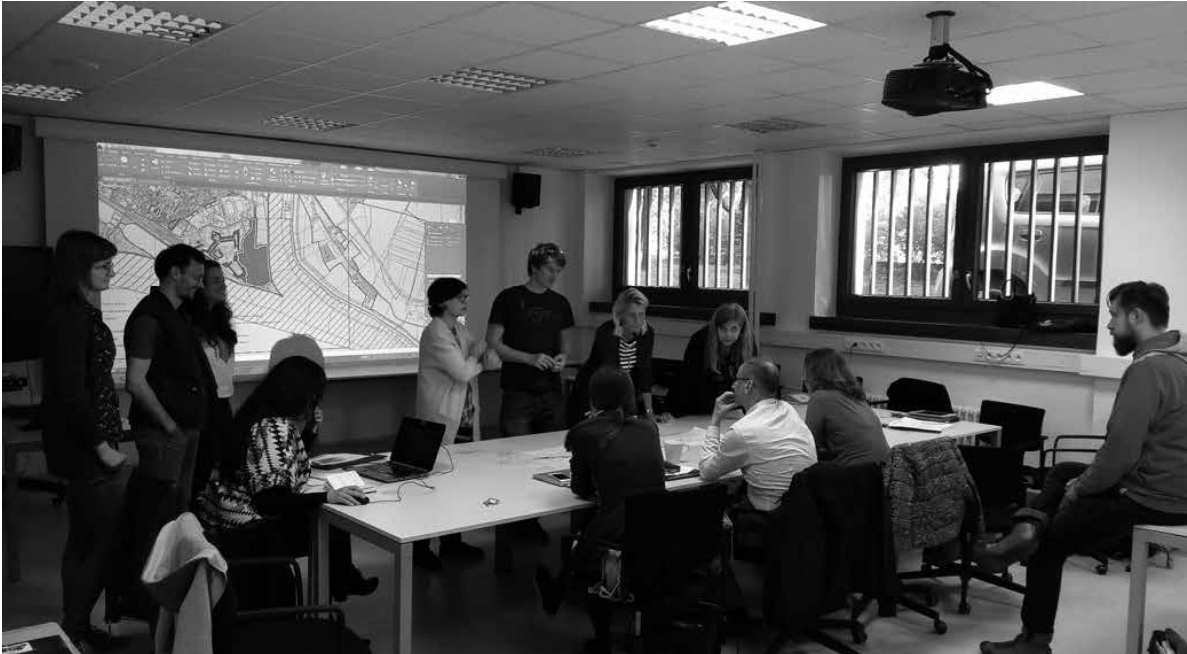
7 Pravidelné stretnutie riešiteľského kolektívu FA STU v priestoroch Univerziténeho vedeckého parku (UVP) na FA STU. Zdroj: Ján Legény

Členovia projektu pracujú na rôznych horizontálnych a vertikálnych úrovniach, v národných a medzinárodných pracovných skupinách a vytvárajú kultúrnu a sociálnu sieť. Partnerstvo v rámci projektu DANURB je otvorené akejkoľvek podpore, myšlienke a prínosu, či už ide o vzdelávanie, cestovný ruch, kultúru, dedičstvo alebo problematiku v rámci rieky Dunaj.