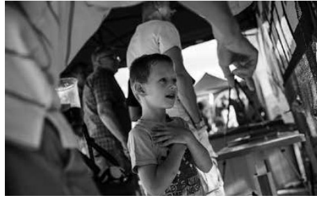
6 Fotografie z festivalu osláv Dňa Dunaja – Danube Day.