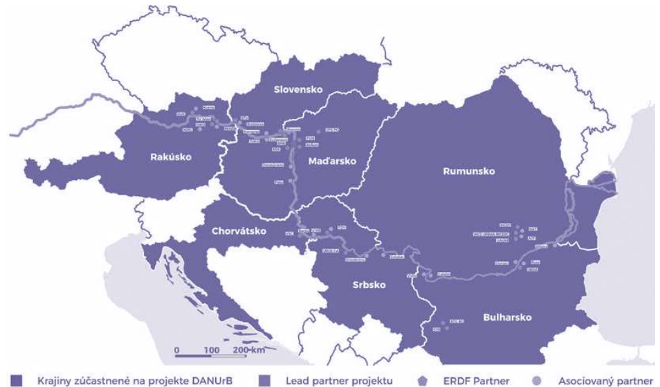
3 Mapa siedmich partnerských krajín podieľajúcich sa na projekte DANURB s vyznačenými 39 partnermi.