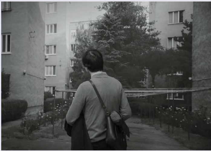
1 Fotografia dvora komplexu Nová doba.