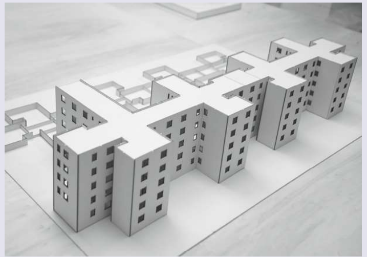
2 Model komplexu Nová doba.

Slovami Henriety Moravčíkovej, autorky komplexnej monografie o Weinwurmovi, Weinwurmovo dielo „predstavuje najkonzistentnejší príspevok slovenského prostredia do aktivít európskej architektonickej avantgardy“ 9 . Po troch rokoch od vydania monografie o Weinwurmovi jej autorka prišla s výstavou, ktorú možno chápať ako ďalší krok k spoločenskému doceneniu osobnosti Friedricha Weinwurma.