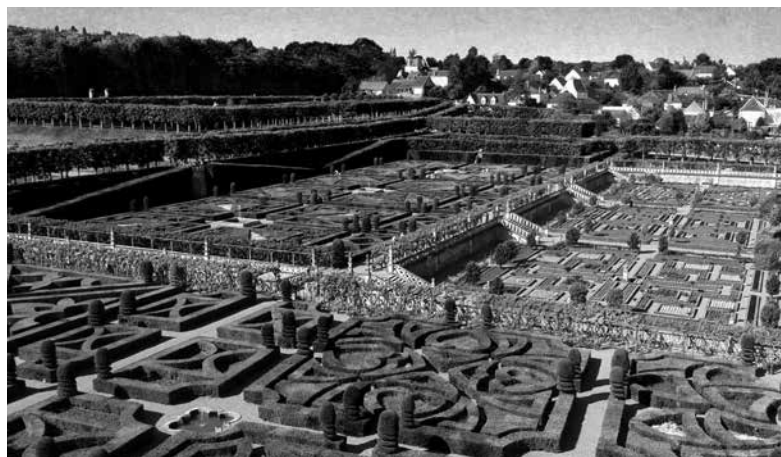
6 Sídlo Villandry

Súčastou areálu je historický park stvorený v štýle anglického parku a menší záhradný areál, v ktorom sa od roku 1992 každý rok organizuje medzinárodný festival záhrad. Vďaka festivalu sa Chaumont opäť dostal do veľkej pozornosti nielen laickej, ale aj odbornej verejnosti. Podstatou festivalu je prezentácia prác novej generácie krajinárov,