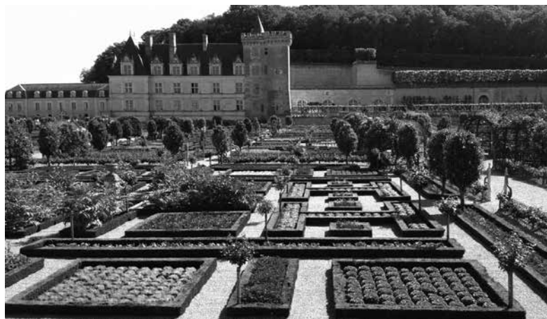
5 Sídlo Villandry