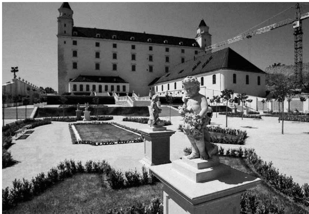
11 Baroková záhrada na Bratislavskom hrade Foto: Eva Putrová, 2016

autor za zakladateľa odboru teórie a dejín záhradného umenia. 19