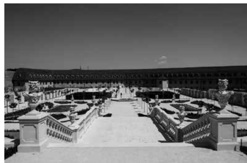
12 Baroková záhrada na Bratislavskom hrade

Významné historické záhrady nesú vo Francúzsku označenie Monument Historique – historická pamiatka a podliehajú