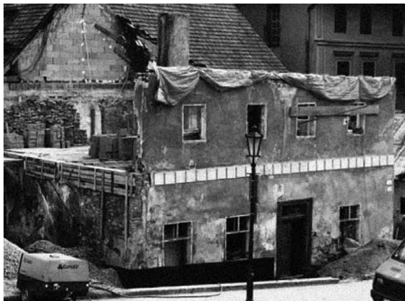
6 Vivisekcia pamiatky. Takzvaná pamiatková „obnova“ meštianskeho domu na Trojičnom námestí v Banskej Štiavnici.