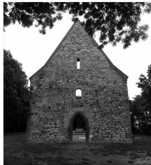
2 Pohľad na očistenú ruinu Pustého kostola vo Veľkej Čalomiji a slohová rekonštrukcia zaniknutej štítovej steny s anastylózou gotického lomeného portálu.