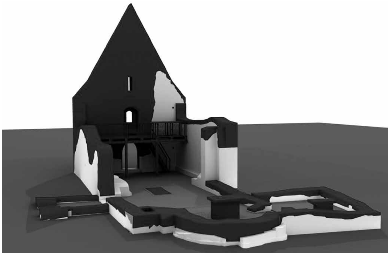
5 Model ruiny Pustého kostola vo Veľkej Čalomiji s vyznačením dostavovaných konštrukcií, štítovej steny, empory, oltárov a ostatných konzervačných zásahov na torzách pôvodných murív. Autor: Pavol Paulíny

pôsobilo miesto ako zaniknutá architektúra, ale jeho výpovedná charakteristika ako „sacrum“ zostávala nedopovedaná. Pri ukončení overovacích štúdií sa preto ako prijateľné riešenie definovala – konzervácia ruiny s doplnením nevyhnutných znakov a charakteristík „kostola“. Koncepcia do seba zahrnuje už spomínané dostavovanie západného priečelia ako čitateľného znaku sakrálnej architektúry, jednotnej podlahy interiéru s náznakom pôvodnej farebnosti, ktorá definovala a súčasne odlišovala sakrálny interiéru od sakrálneho exteriéru cintorína, vybudovanie oltára v mieste pôvodného barokového oltára, „ukotvenie“ osového pohľadu z lode do apsidy náznakom retábula, v našom prípade v exteriéri kresťanským znakom kríža a vybudovanie empory, ako typického znaku vidieckych kostolov na našom území. Miera zásahu bola hľadáním rovnováhy medzi zachovanou stavebnou substanciou a potrebou novej funkcie, vytvárajúc možnosti medzi muzeálnou expozíciou a kultom. Zjednodušene povedané „pasívna“ ver- sus „aktívna“ pamiatka. 18 (→ 5)