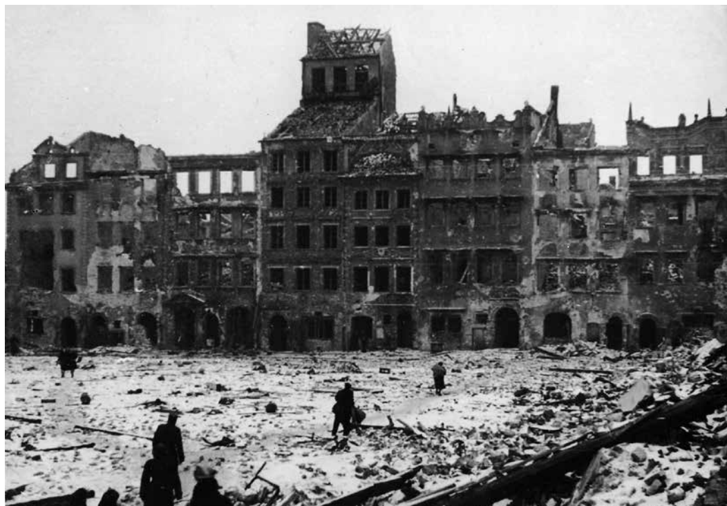
3 Pohľad na zničenú časť hlavného námestia vo Varšave a rekonštrukcie z 50-tych rokov 20. storočia.