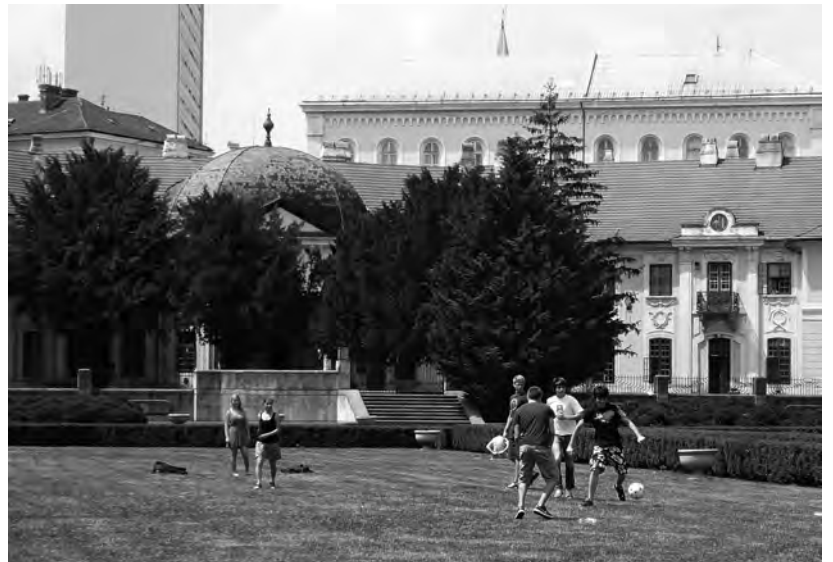
5 Pôvodné barokové záhradné partery ako aktívne plochy na hry a šport.

zimné klzisko či areál s fitness prvkami. (→6) Napriek tomu si záhrada ešte ako-tak udržiava svoju historickú kompozičnú tvár, avšak je to pravdepodobne len otázkou času dokedy, ak bude tento trend pokračovať.