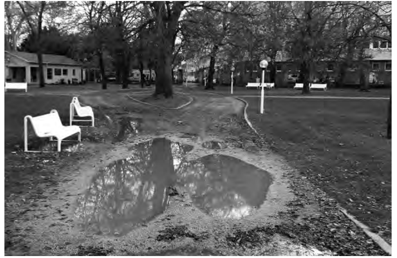
3 Vyjazdené priehlbiny zničených komunikácií sa v dôsledku zhutnenia plnia dažďovou vodou.

osemdesiatych rokov však záhradu zrekonštruovali do podoby z roku 1820, ktorá ešte čiastočne odrážala pôvodný barokový pôdorys. V súčasnosti je záhrada evidovaná ako súčasť národnej kultúrnej pamiatky Aspremontov palác, číslo ústredného zoznamu 263 (záhrada reprezentuje samostatný pamiatkový objekt). Medická záhrada je obľúbeným miestom obyvateľov aj návštevníkov mesta a tomu zodpovedá aj rozsiahly zoznam prvkov a aktivít, ktoré sa v nej nachádzajú alebo realizujú. Sú tu dve detské ihriská, pamätník básnika Sándora Petőfiho, pamätník spisovateľa Martina Kukučina, fit prvky pre seniorov, verejné toalety, čajovňa (v letnom období), letná čítareň a kaviareň. (→1) Niekoľkokrát do roka sa v záhrade konajú masové príležitostné akcie 13 , napríklad gastrofestival, detský haloween, vegánske hody, deň detí a podobne.