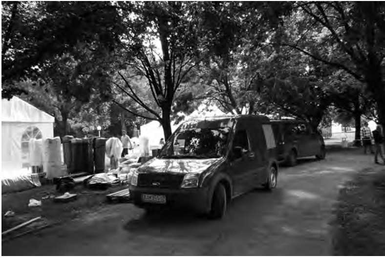
2 Príprava na gastronomický festival a s ňou spojené zaberanie plôch zelene.