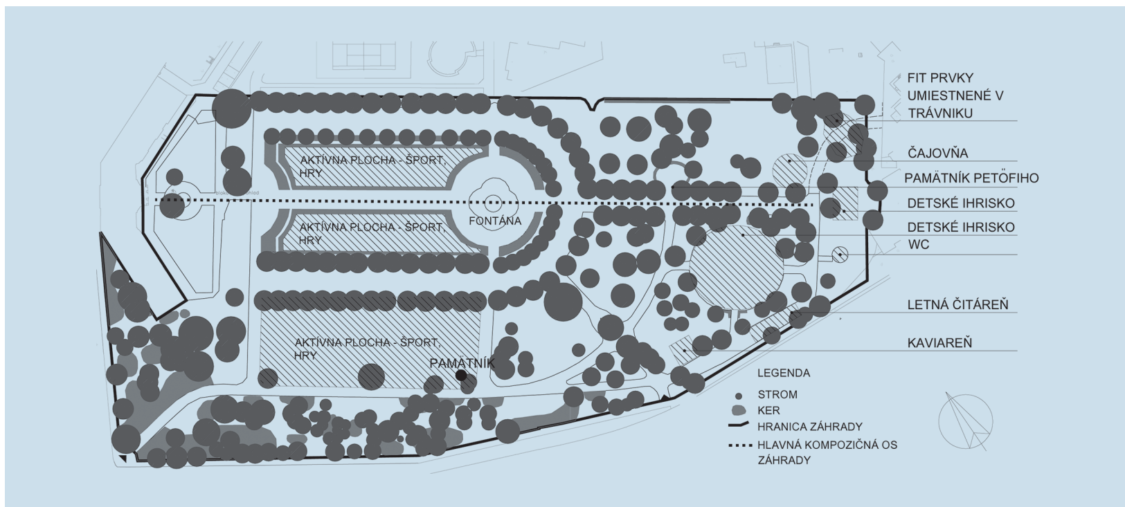
1 Schéma rozloženia jednotlivých aktivít v Medickej záhrade v Bratislave. Autorka: Miriam Heinrichová <