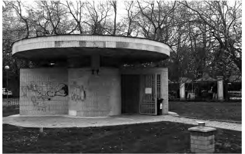
4 Nadzemná časť toaliet v Medickej záhrade.