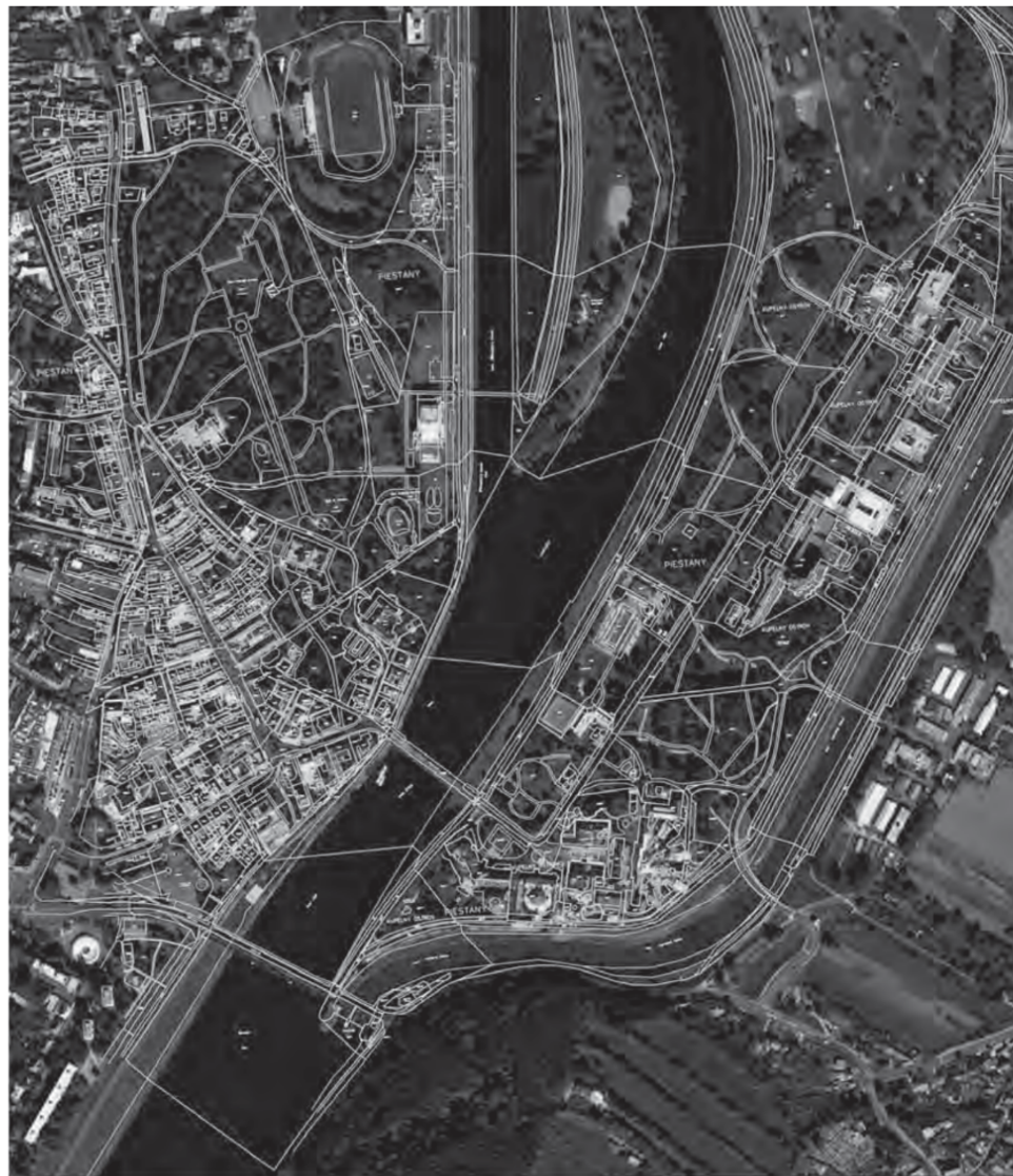
2 | Premeny krajinej štruktúry Piešťan na začiatku 19. storočia, v tridsiatych rokoch 19. storočia, v dvadsiatych rokoch 20. storočia a od sedemdesiatych rokov 20. storočia – centrum a kúpeľný ostrov.

Autorka Miriam Heinrichová, Ortofotomapa © Google Autorka Miriam Heinrichová