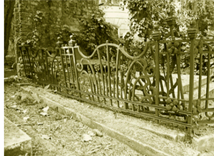
Detail neobarokovej mreže okolo hrobky neznámej rodiny pred múrom severnej časti cintorína