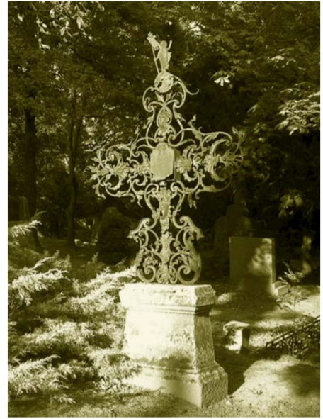
Neobarokový kovaný kríž nad hrobom Rudolfa Varadina