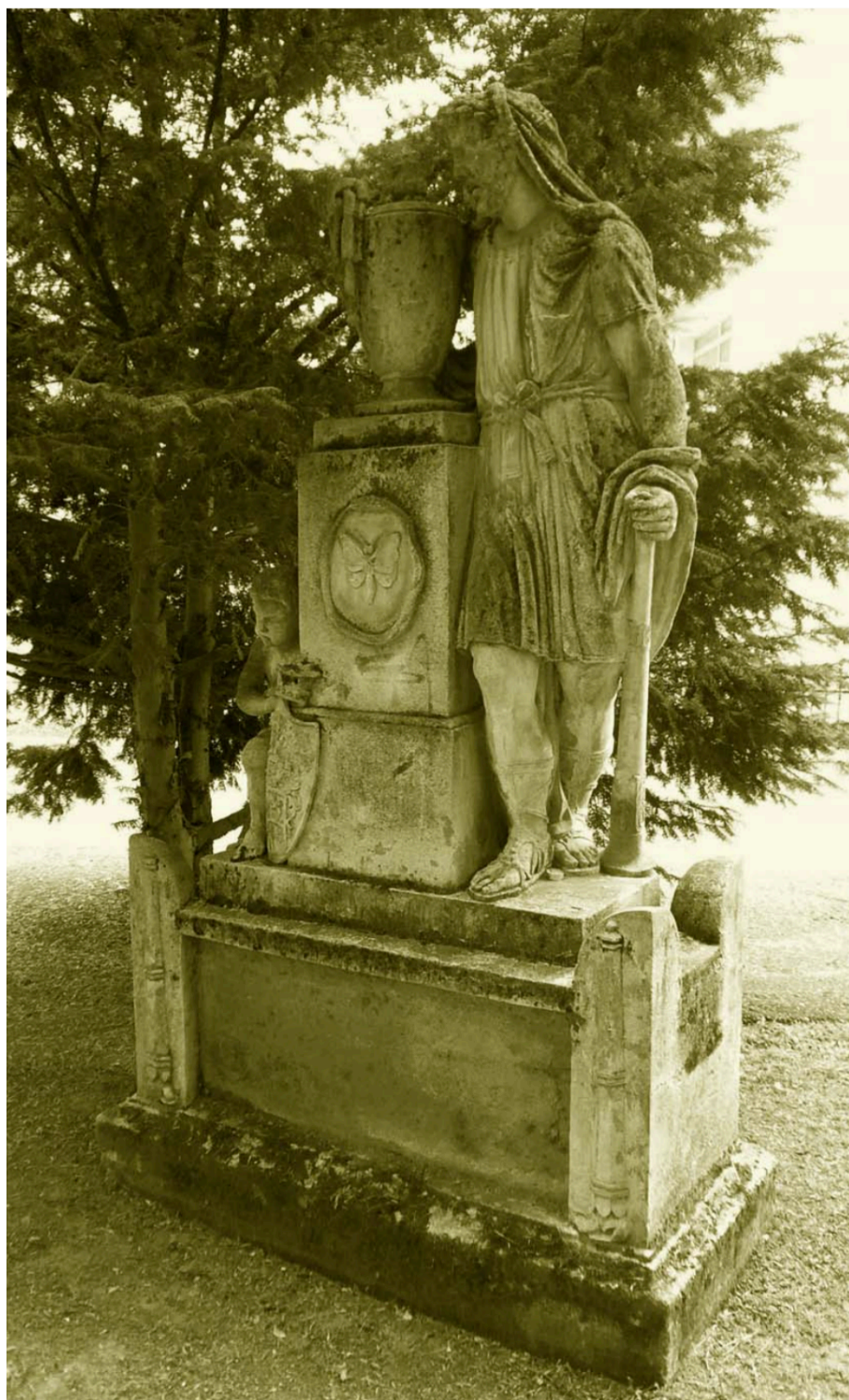
Náhrobník neznámeho aristokrata s figúrou Herkula v blízkosti vstupu zo Šulekovej ulice