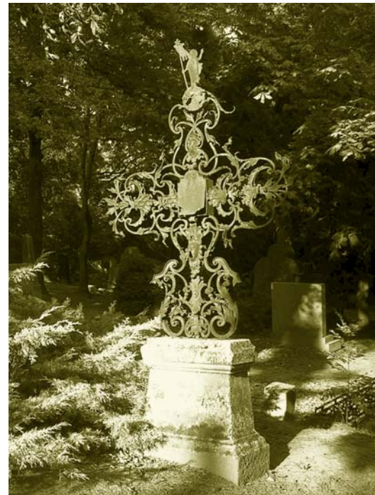
Neobarokový kovaný kríž nad hrobom Rudolfa Varadína