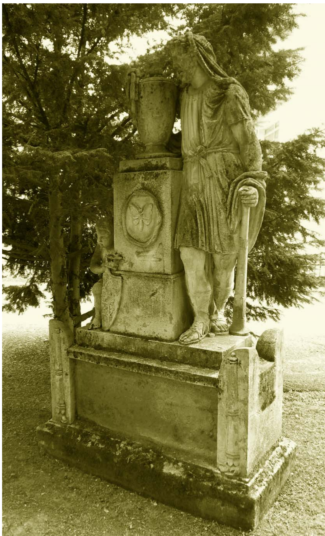
Náhrobník neznámeho aristokrata s figúrou Herkula v blízkosti vstupu zo Šulekovej ulice