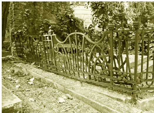
Detail neobarokovej mreže okolo hrobky neznámej rodiny pred múrom severnej časti cintorína