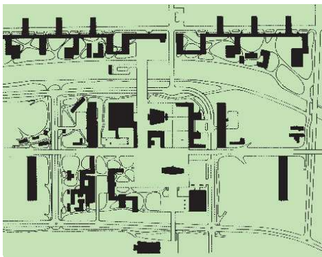
6 | Mukařov, Česká republika, zdroj: Hnilička, Sídlní kaše

bývania, záhradu, zdravšie prostredie a vyšší sociálny status. Tento model sa stal okamžite atraktívnym a napriek jeho následnému častému zneužívaniu, do dnešných dní je často využívaným modelom. „Ak by sme zmerali vplyv hnutia záhradných miest na základe dopadov ich priameho potomka – urban sprawl – vplyv tohto hnutia značne prevyšuje vplyv funkcionalizmu.“ 20 Napriek tomu, že sa iniciálne prejavil v západných rozvinutých kapitalistických krajinách, od deväťdesiatych rokov fenomén tzv. sídelnej kaše (urban sprawl) výrazne ovplyvňuje formu aj našich miest, ako aj prevádzkové vzťahy a dostáva sa mu čoraz väčšej pozornosti. Najmarkantnejším symptómom je rapidný nárast extenzívnej zástavby kolónií rodinných domov (obr.5,6), ktorému sa obširnejšie venuje Hnilička. 21 Kobercová zástavba rodinných domov je však len jedným z fyzických prejavov tohto fenoménu, ktorý je charakterizovaný nespojitou zástavbou, keď napriek častému priestorovému funkčnému premiešaniu je každá nová výstavba pojednávaná ako samostatná entita s napojením na hlavnú zbernú komunikáciu bez reflexie okolitej zástavby. Pešia dostupnosť ani nadväznosti verejných priestorov jednotlivých súborov nie sú predmetom záujmu, keďže tento typ výstavby predpokladá primárne využitie automobilovej dopravy na dosiahnutie vytýčenej cieľovej oblasti (obr.7).