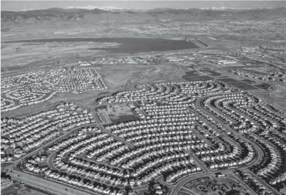
3 | Tradičná a funkcionalistická urbánna forma, diagram: Rowe, C., – Koetter, K., zdroj: Carmona et al., Public Places Urban Spaces: The Dimensions of Urban Design

bázy, z ktorej súčasná legislatíva týchto krajín vychádza, rovnako ako aj poukázaniu na potenciálnu relevantnosť týchto diskurzívnych náhľadov v našich podmienkach.