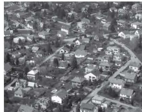
4 | Västra Forlunda, Švédsko

Rast priemyselných miest spočiatku charakterizovalo zvyšovanie hustoty. Rozvoj predmestských železničných systémov od konca 19. storočia vyústil aj do rapidného nárastu plošnej rozlohy. Začiatok 20. storočia bol svedkom implementácie autobusov a električiek, vo väčších mestách aj podzemných dráh. To umožnilo decentralizáciu, v prvej fáze rezidenčných zón. Nová forma urbanizácie, ktorá sa významne líšila od tradičnej urbánnej formy, bolo predmestie. Postupne sa vyvinuli dva základné modely – „Kompaktnejšie predmestie s vyššou hustotou a dochádzkovými vzdialenosťami (tradičný urbanizmus) a menej kompaktné predmestie s nižšou hustotou, orientované na využitie automobilovej dopravy, polycentrický (sub)urbanizmus.“ 19 Pôvodnou motiváciou pre hnutie záhradných miest s ich idealizovaným predmestským modelom bolo uniknúť industriálnemu mestu, jeho znečisteniu, chorobám a kriminalite. Koncepcia „bývania v zeleni“ ponúkala lepšiu kvalitu