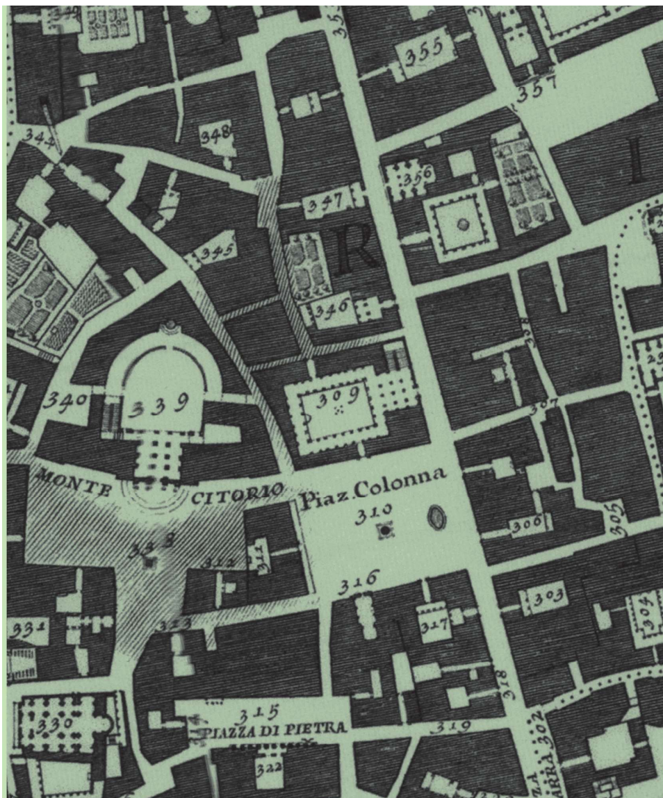
1 | Verejný mestský priestor, časť Nolliho mapy Ríma zdroj: http://nolli.uoregon.edu/

výskumov viedli k legislatívnym zmenám a úpravám, ktoré sa týkajú obsahu a formy územných plánov, so zameraním sa, okrem iného, na komplexnú stratégiu tvorby verejného mestského priestoru.