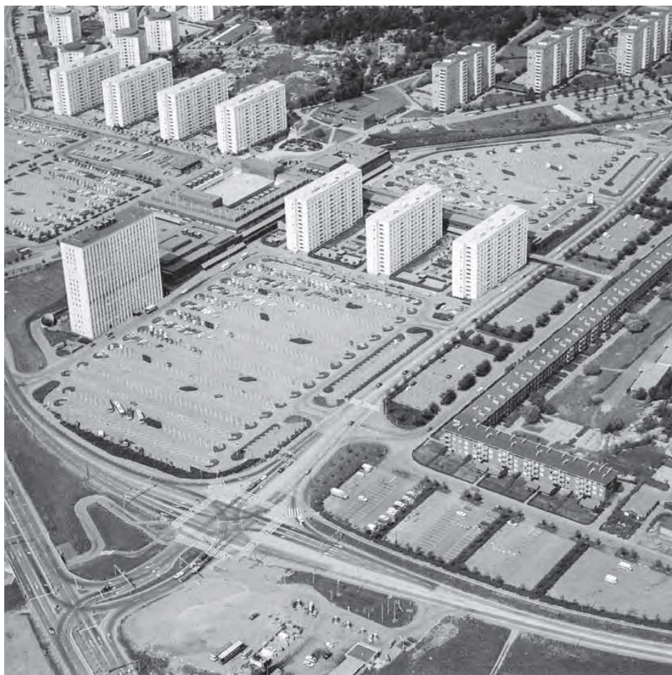
7 | Vzájomne prepojené mestské priestory a izolované entity, diagram: Duany, A. – Plater-Zyberk, E.

Príspevok je súčasťou výskumu k dizertačnej práci.