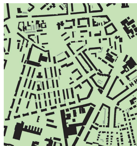
2 | Štruktúra objektov a urbánny priestor

Aby sme boli skutočne schopní pochopiť legislatívne zmeny v západných krajinách, zhodnotiť ich predvídateľný vplyv na mestskú formu a verejnú sféru, porovnať ich s predvídateľným vplyvom našich postupov a eventuálne ich využiť ako impulz na prehodnotenie nášho legislatívneho prístupu v danej oblasti, je potrebné najprv dosiahnuť hlbšie pochopenie ich východísk. Tento príspevok sa preto venuje hlbšiemu ozrejmieniu kontextu teoretickej